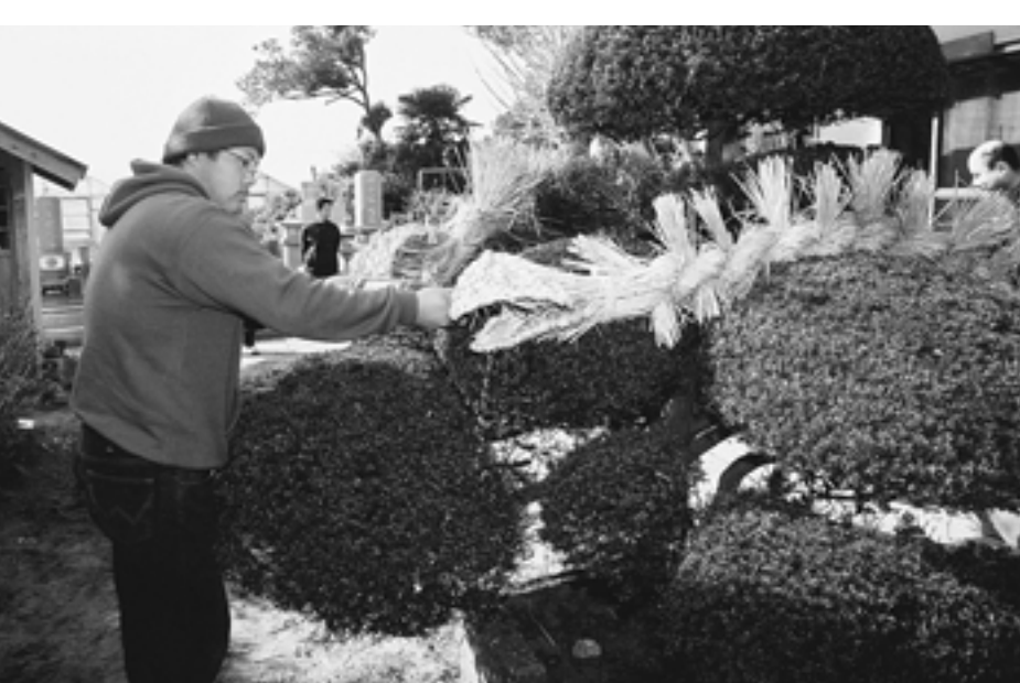
わらで作った大蛇にお神酒で魂を入れる（豊栄地区時曾根の大蛇まつり）

稲作農業が生活の中心であったこの地域では、年中行事もそれと結びついて行われてきました。二月八日は「事八日」ことよ