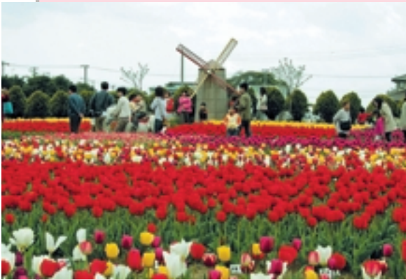
色とりどりのチューリップに囲まれて(昨年)

イベント内容:のさか太鼓、ピノゴ大会、ミニ動物園(花畑の中をボニーに乗って散歩)、もちつき大会、オーナー抽選会、景品付きもち投げ 開催場所:のさか花の広場(野栄総合支所前) 問い合わせ:のさかチューリップ祭り実行委員会・野栄総合支所地域整備室 ☎67・3114