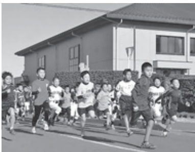
一斉にスタートする子どもたち(昨年)

②=0.56km ③=1.22km ①②③⑬⑭⑮=1.29km ④⑤⑥⑦⑧⑨=1.66km ⑩⑪⑫⑬⑭⑮⑯⑰⑱⑲⑳㉑=2.07km ⑥=3.2km ⑦⑧⑨=3.66km