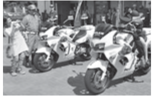
白バイに乗って記念撮影(昨年)

この運動の一環として、千葉県警察音楽隊による演奏や子ども向け企画などを通じて、楽しく交通安全を学べる「秋の交通安全フェスタ」を開催します。