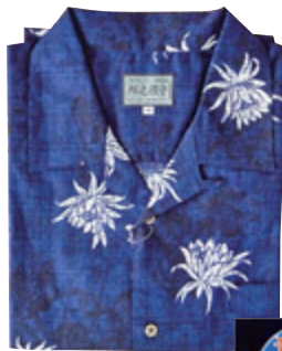
ウェアに入る「匝瑳」ロゴと スーパーアロハ

ウェアは、匝瑳の語源である「狭布佐」にちなみ、美しい麻仕立ての「スーパーアロハ」と、ドライメッシュ素材の「ポロシャツ」の2種類です。