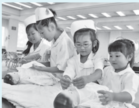
上手にオムツ交換できるかな(昨年)