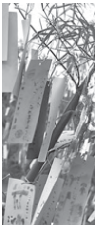
七夕に向けて願い事を書こう

患者さんや家族の皆さんが健やかに過ごされるような短冊を募集していますので、皆さんも思い思いの短冊をつるしませんか。期間…7月7日(火)まで