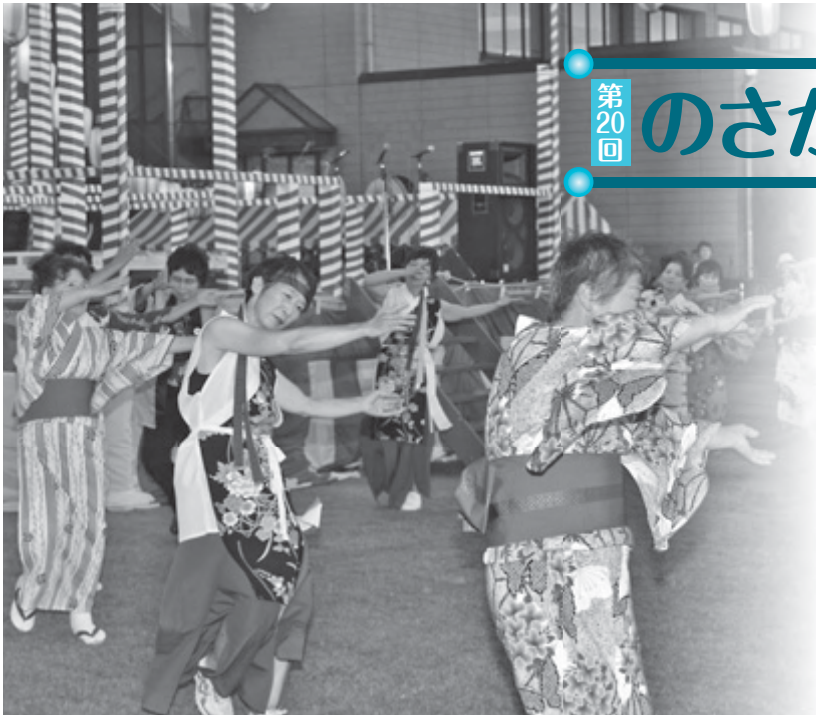
みんなで踊ろう盆踊り(昨年)

20回目を迎える「のさかふれあい祭り」が、さざんか広場周辺を会場として開催されます。