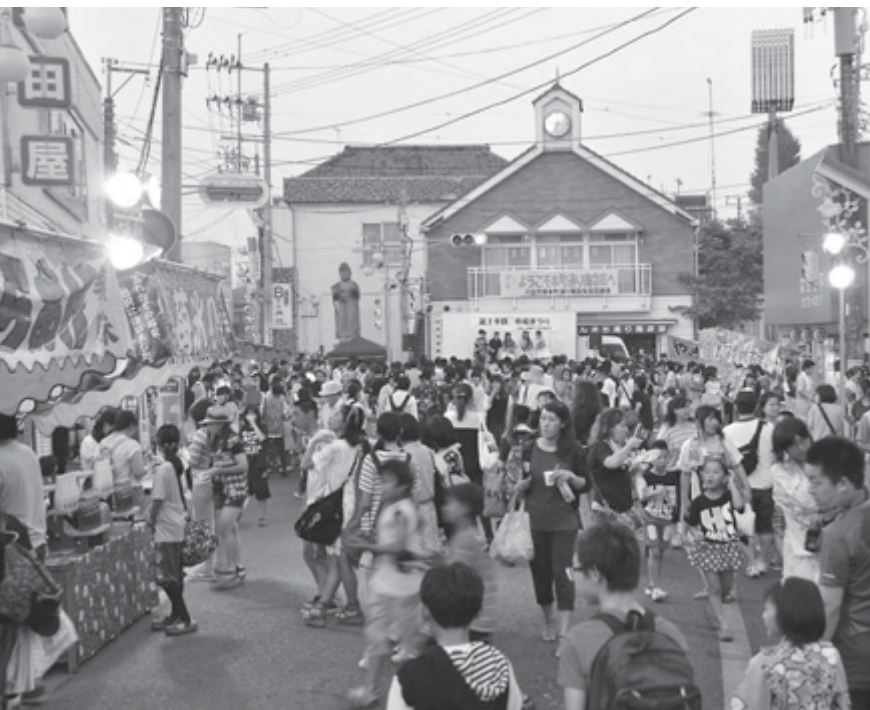
にぎわいをみせる本町通り商店街(昨年)