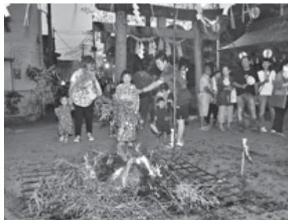
八重垣神社で健康を願って(昨年)

渡御が行われます。また、24日は歩行者天国となりNTT西側にあるお祭り広場で各種催しが行われます。