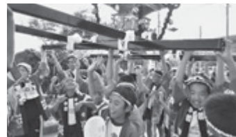
ワッショイ、お神輿を持ち上げろ!

のさか幼稚園、栄・東保育園、野田・栄小学校から計8基の子ども神輿が、総勢100人以上の参加者とともに、野栄総合支所に集まります。