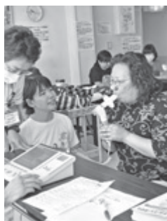
肺年齢測定を受ける参加者

ばこを吸っているとこの現象が起きません。手遅れ状態になってやっとなり付くのです。周産期死亡の10%、低出生体重児の35%、早産の15%が母親の喫煙習慣を原因としています。また、出生後の乳幼児突然死症候群(SIDS)、中耳炎、行動障害、口蓋裂や口唇裂などの先天異常の危険性が高まることが報告されています。