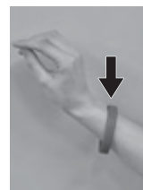
認知症サポーターを表すオレンジリング