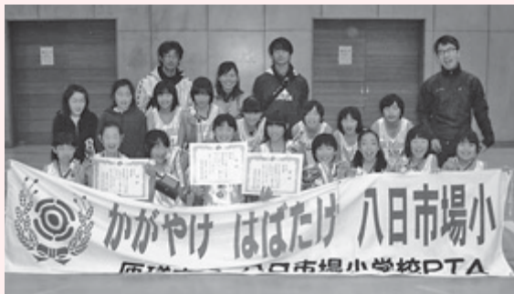
八日市場小チーム