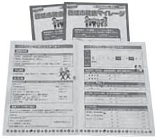
チャレンジシート（兼申請書）

「匝瑳市健康マイレージ」とは、11月30日（水）までのチャレンジ期間中に、健診（検診）などの受診や個人の健康目標への取り組みなどを