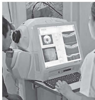
眼科に導入した光干渉断層計

資本的収支は、将来の経営活動に備えて行う医療機器の購入や施設整備などの支出とその財源として収入となる出