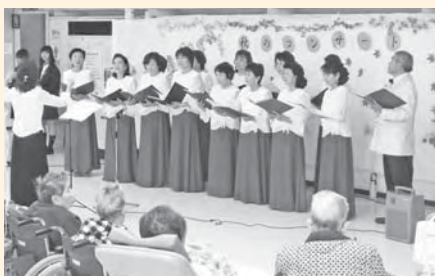
コーラスいちょうの発表(昨年)

市民病院内でミニコンサートを開催し、入院患者さんやその家族にくつろぎの時間を提供します。一般の人でも楽しむことができますので、どうぞお越してください。日時…11月12日(土)14時~15時 内容…コーラスいちょう、竹の子オーケストラとUFOの演奏