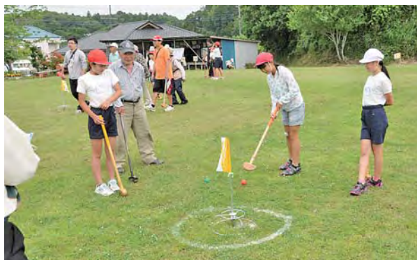
ホールインを目指してクラブを振る小学生

大会が始まると、豊和小5・6年生の24人にシニアクラブ会員らが混じり、6人1組の計10組でプレー。初めは空振りやミスショットが多かった子どもたちも、地域のおじいちゃん、おばあちゃんに「うまいまい」と声を掛けられて、次第に上達を見せました。