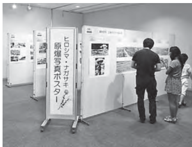
戦後70年の節目となった昨年は、原爆ポスター展を開催し戦争の悲惨さを伝えた

戦後71年を迎え、戦時下の暮らしの様子を知る人々も高齢化し、現在の豊かな生活の中で戦争の記憶は徐々に薄れつつあります。そこで、国民が経験した戦