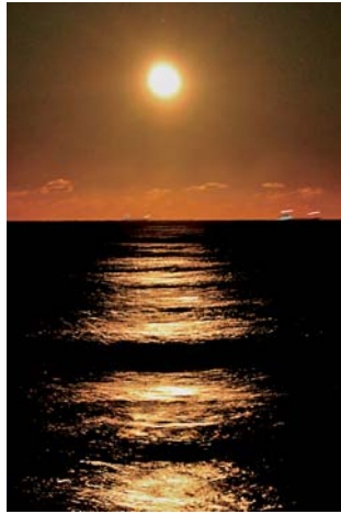
撮影場所・香取市

「満月の夜、海面から天空へ導く光の階段が現れる。その光景に見入る時、輝く月へ昇りたくなる」