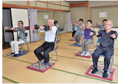
「いきいき百歳体操」始めて、元気で長生きしましょう