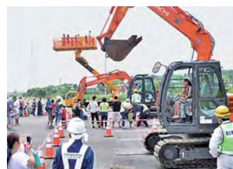
建設系機械の試乗体験

地域の子どもの若い親世代に地域の産業や仕事を知ってもらうことを目的としたもので、消防や自衛隊、建設系機械などの働く車の展示や各種体験などを通し、いろいろな仕事を紹介。この他、地元製品の販売、ソーサマンショー、近隣ご当地キャラクターなどの紹介が行われ、大きな盛り上がりを見せました。