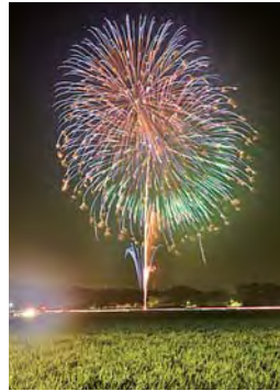
水田上に広がる大輪

毎年8月15日に開催される、収穫 間近の水田を照らす風情ある花火大 会。誕生祝いや長寿祝い、健康祈願 商売繁盛などの思いが込められ、約 100発の花火が打ち上げられます。 時間…20時~21時 場所…匝瑳地区 大浦(匝瑳保育園北側) 圃匝瑳市観光協会事務局(産業振興 課内) ☎73-0089