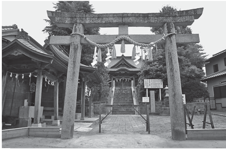
謎を残す八重垣神社正面の鳥居

治の初めまでは、「天王宮」や「天王様」と呼ばれていました。古いものでは、1606年に神輿が新調されたとありますが、1670年2月の見徳寺門前の大火で神社とともに神輿も焼失したようです。夏祭りを控え「町中惣氏子」により6月に神輿を造ったとの記録があります。