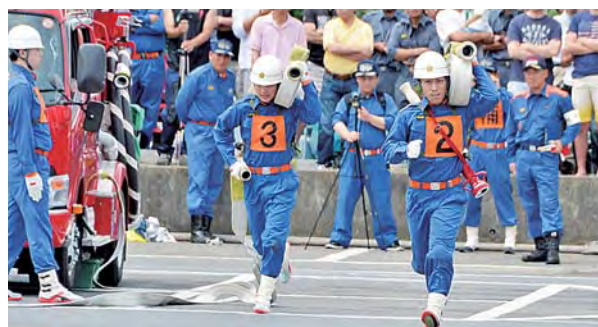
演技を披露する中央分団第4部