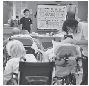
ぬくもりの郷で行っている食事前の口腔体操

細菌の侵入口です。細菌を多く含んだ唾液を誤嚥することで、肺炎を引き起こすこともあります。口腔内を清潔に保つことは、気分を爽快にして食欲を増進させる上、口腔が敏感な人は反射を抑制、