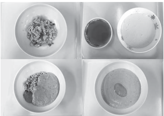
市民病院で提供している嚥下食。右上から時計回りにムース食、全粥トロミ食、刻みトロミ食、刻み食

加齢とともに、唾液量の減少や食べ物をかんだりする機能の低下が起こります。病気の影響で、かむ力や飲み込む力に障害を生じる人も増えていきます。これらが原因で、誤って飲食物が肺や気管支の方へ入ってしまう「誤嚥」(むせ込むことが多い)を起こしやすくなります。こうした状態を「嚥下障害」(飲み込みの障害)と言います。むせ込みが頻繁に生じると、