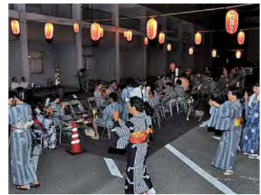
「権左が西国」などの音色に合わせて披露される踊り

時間…19時~ 場所…八日市場公民館南側駐車場 圃生涯学習課生涯学習室 ☎67-1266