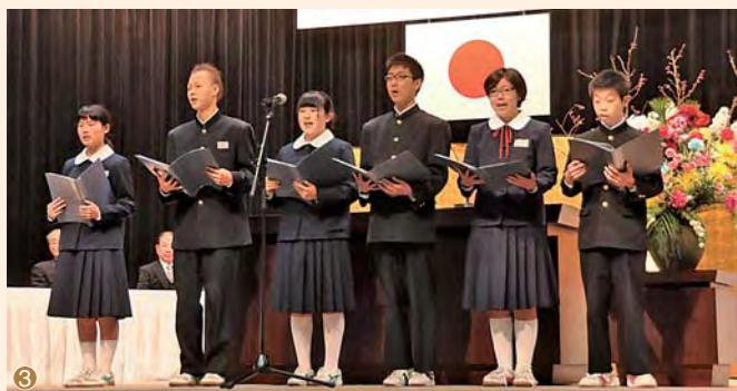
① 式辞を述べる太田市長 ② あいさつする栗田市議会議員 ③ 市民憲章を朗読する市内中学校の代表生徒

平成18年1月23日に匝瑳市が誕生して、今年で10年を迎えました。この節目の年に当たり、10周年を記念する式典が3月26日に、八日市場ドームで挙行されました。