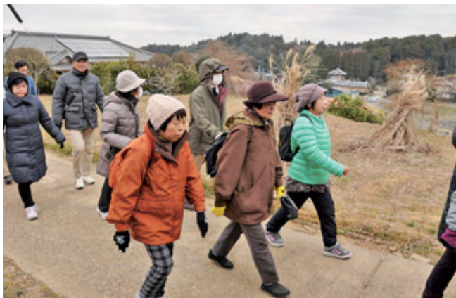
ふれあいパーク近くの集落内を歩く「ふれあい散歩」参加者