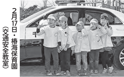
2月17日・椿海保育園 (交通安全教室)