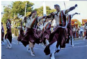
観光部門 金賞 「躍動」