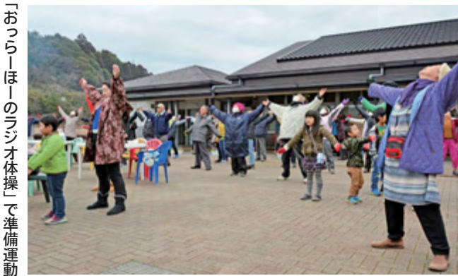
「おっらーほーのラジオ体操」で準備運動

開会セレモニーで太田市長が「今日は新たなスタートを切る日。今後もまちづくりに着実な歩みを進めたい」と挨拶すると、50人が参加したふれあいパーク周辺を巡る「ふれあい散歩」のスタート前に、全員で地元言葉の掛け声によるラジオ体操「おっらーほーのラジオ体操」で準備運動を行いました。また、のさか太鼓による迫力満点の演奏や子どもたちの笑顔あふれるソーサマンショーなどが行われ、大きな盛り上がりを見せました。