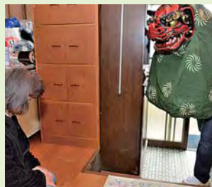
獅子が家々を訪れ厄除けを行う

豊栄地区飯倉で獅子舞が行われました。この日は昔から「事八日」と呼ばれ、疫病神などが来訪する日と伝えられています。地区の若者衆が子安神社で一年の無事を祈願した後、獅子の装束をまとった地区内の家々を訪問し、魔除け・厄除けを行いました。