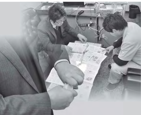
さあ、禁煙に取り組もう!

広報担当(以下A) これまで「広報そうさ」で取り上げた話から、半年前から気持ちの変化はありましたか? Aさん(以下A) 第6回(10月号掲載)で「運動機能の低下」について説明がありましたが、自分のことを考えると年齢的な問題だけでなく、やはり、たばこの影響があるのかなと考えてしまいますね。 B 二人とも気持ちに変化があったということですね。 A 年末年始に、日頃のストレス発散になると思いますが、久しぶりにサイクリングに出かけたんです。でも思った以上に疲れてしまっていて、定期的にスポーツもやっているから、まだまだ学生時代と変わらないかと思っていれば、想像以上に走れない、疲れてしま