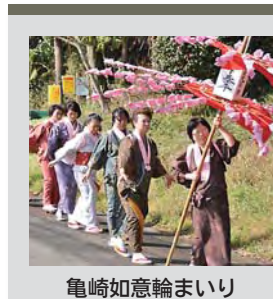
亀崎如意輪まいり

編集後記 ▽2月14日、「亀崎如意輪まいり」の撮影に伺いました。春一番が吹いたこの日、風の中で、万燈をかざしたり、踊ったりするのは大変なことだったと思います。来年は、穏やかな日に行えるといいですね。(越川)