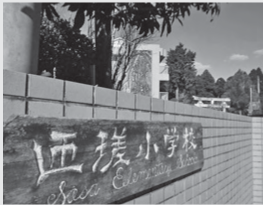
140年の歴史に幕を閉じる匠瑳小学校の校門