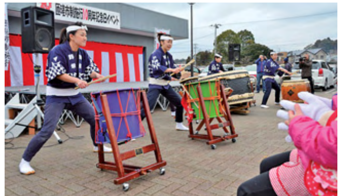
力強いのさか太鼓の演奏