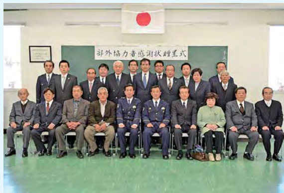
贈呈式に出席した被表彰者ら