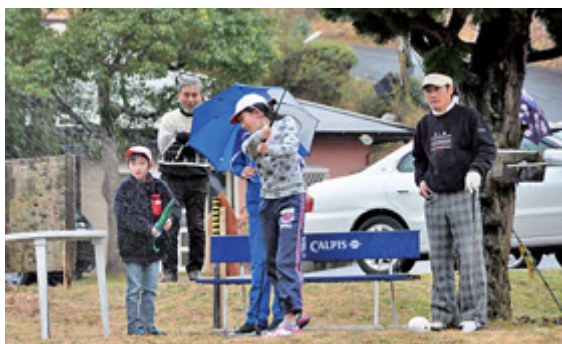
1年間の練習の成果をコースで披露する児童

平成25年に発足した同クラブは、今年4月に同小が八日市場小に統合することから今回が最後の活動日になりました。小雨が降るあいにくの空模様でしたが、児童たちは大人を含め6人1組で計4ホールをプレーし、3年間の活動に別れを告げました。プレーを終えた児童は、「無くなってしまうのは寂しいけれど、機会があればまたゴルフをやりたい」と元気に話していました。