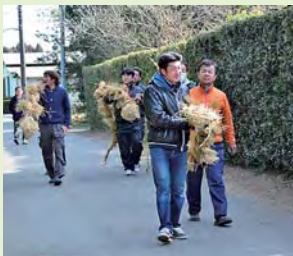
3匹の大蛇を入口へ運ぶ

豊栄地区時曾根で大蛇まつりが行われました。わらで長さ3m、太さ30cmにもなる大蛇3匹を編み上げると、口に厄除け札を入れ、お神酒を飲ませ入魂。集落の入り口3か所の木にそれぞれ吊るし、疫病退散を祈願しました。