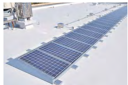
生涯学習センター屋上に設置した太陽光パネル

市では、災害時の指定避難所となっている生涯学習センターに太陽光発電設備を設置し、2月15日から稼働を開始しました。