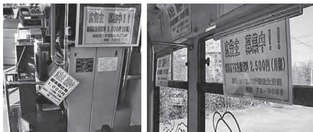
額面広告(上)と配布型広告