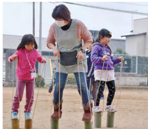
「ぼっくり」で遊ぶ参加者