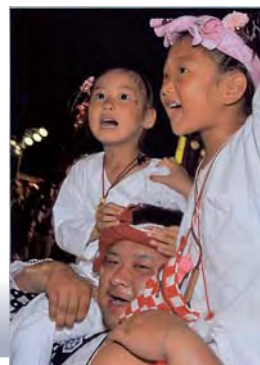
ファミリー部門 金賞 「やっぱり親子」