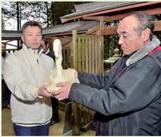
次の当番地区へ渡される 鶴のしんこ餅

豊和地区飯塚の松峰神社で御奉射が行われ、五穀豊穡を祈願しました。厳粛な儀式が終わると、縁起が良いとされる「鶴」と「亀」をかたどった大きなしんこ餅が、新旧当番地区の間で交換されました。