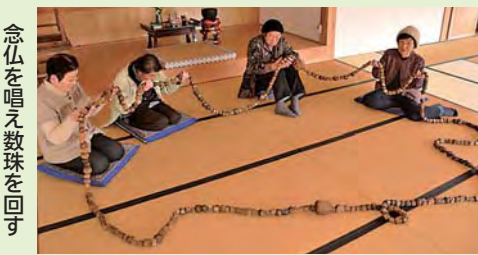
念仏を唱え数珠を回す

長さ10m近くにもなる大数珠を、地区のお年寄りが輪になり念仏を唱えながら順送りする匝瑳地区中台の行事「大数珠くり」が、同地区の竜院で行われました。この日集まった4人は念仏を繰り返して唱えながら大数珠を4周回し、数珠の大きな房の部分が自分の所に回ってくる、房に向かい頭をたれました。