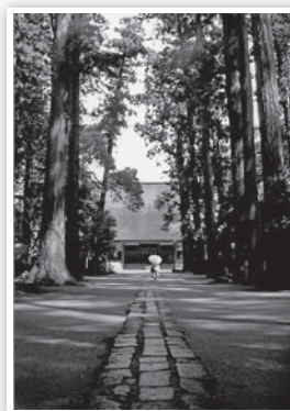
第12回金賞作品「石畳の向には」