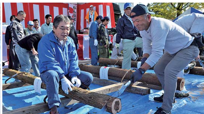
(写真右) 手に汗握る「丸太切り競争」、(同左上) クライマックスは「抽選くじ付き紅白もち投げ」で大興奮、(同左下) 地元産品を買い求める来場者