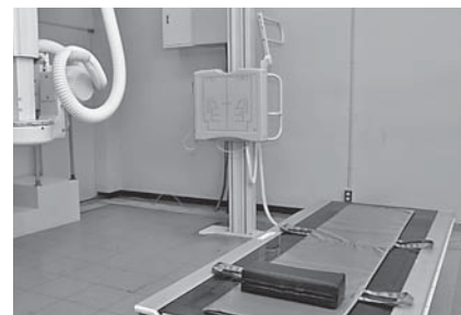
市民病院の放射線科に整備した一般撮影装置（FPDシステム）

※決算概要および財政状況についての問い合わせは財政課財政班 ☎73-0085へ、病院事業会計についての問い合わせは市民病院 ☎72-1525へ