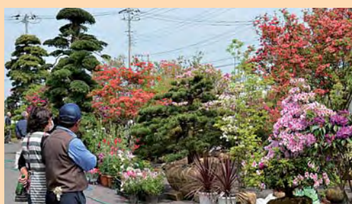
色とりどりの花木が並ぶ祭り会場

場所 平山邸(安久山197番地) 時間 10時~15時 ※入園料大人500円の負担有り(中学生以下無料)