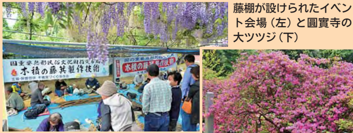
藤棚が設けられたイベント会場(左)と圓實寺の大ツツジ(下)

“ふじの里”木積地区では300本余のフジがお出迎え。樹齢100年以上の龍頭寺の大フジや、人の背丈をはるかに超える圓實寺の大ツツジなど見どころ満載。6日(土)は、イベント日で国指定重要無形民俗文化財「木積の藤箕製作技術」の実演などがあります。“ふじの里”散策をお楽しみください。