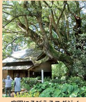
庭園にそびえるスダジイ