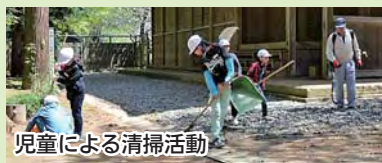
児童による清掃活動

管理などを行っていきま す。活動を 通して、4 00年以上 ある檀林の 歴史を次の 世代へ伝え ていけたら いいです ね」