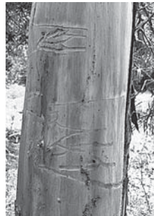
樹皮を剥いで確認できる食害痕