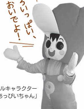
赤ピーマンのシンボルキャラクター「あっぴいちゃん」