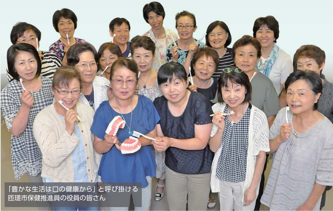
「豊かな生活は口の健康から」と呼び掛ける 匝瑳市保健推進員の役員の皆さん

知らず知らずに忍び寄る黒い影「歯周病」。全身の健康と密接に関わっていても初期の自覚症状がほとんどないことから、つい見落とされがちな疾患です。「お口の健康」を保って、いつまでも豊かな生活を送れるよう、歯科医院での定期的な健診や日ごろの手入りに努めましょう。