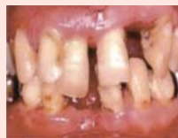
重度の歯周病にかかった口