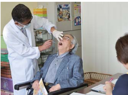
いつまでも自分の歯で元気に過ごせることを目指して「8020運動」を推進（高齢者のよい歯のコンクール審査会。5月24日）

計画策定のために実施した市民アンケートでは、定期的に歯の健診を受けている人の割合（20歳以上）は4割に満たない状況で、その理由として「特に気になるところがない」「忙しい」が多くを占めて