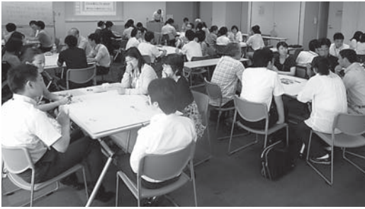
参加者同士で机を囲み理解を深める