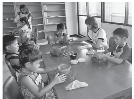
講座の様子(写真は夏休み陶芸)