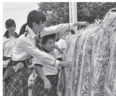
昨年のセレモニーで折り鶴をささげたガールスカウトのメンバー

50羽ずつ(7・5cm角の折り紙の場合)、丈夫な糸を使って下部から折り鶴が抜け落ちないように束ねた状態にしてください。セレモニーを8月1日(水)8時から八日市場駅前で行います。折り鶴は、同所に8月15日