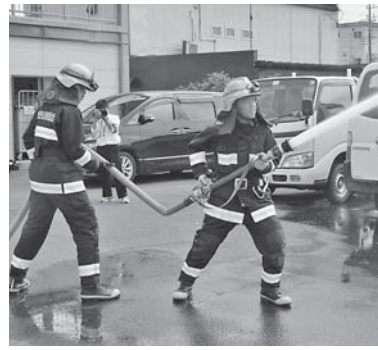
消防署での放水体験（昨年）

この取り組みは、中学生が実際に店舗などの事業所で接客などに携わり、作業内容の他、あいさつや礼儀などの指導を受けるもので、未来を担う子供たちにとって将来の生き方や職業観を学べるなど、学校生活の中だけでは得られない素晴らしい学習の場となっています。