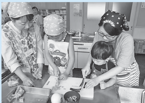
わんぱくクッキングの様子(昨年)