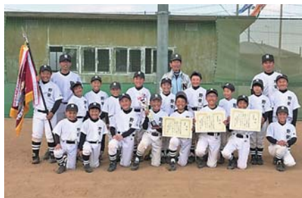
野栄スポーツ少年団