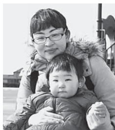
秋山さん親子(飯高)

初めて来ましたが広々としていて良いですね。子どもは1歳5か月で歩くのが楽しいみたい。私もこれからママ友と一緒に楽しめそうです。