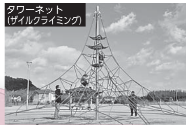
タワーネット (ザイルクライミング)