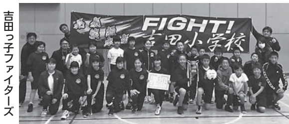
吉田っ子ファイターズ