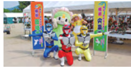
宍粟市のイベントでしーたん(6月)

※行事詳細チラシは10月18日(木)の新聞折込および市内公共施設で配布します。 ◆市内循環バス臨時便運行 ルートを一部変更して運行します。ダイヤ・便数は通常運行時と同様です。 休止停留所：籠部田、法務局前、富谷、公民館入口、本町通商店街、東本町、田町、二中前