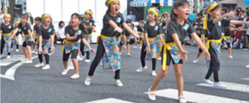
園児のストリートパフォーマンス(昨年)