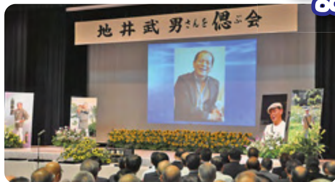
地井さんが好きだったヒマワリが飾られたステージ