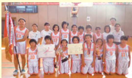
女子の部で優勝した八日市場小