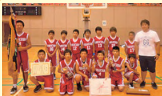
男子の部で優勝した八日市場小

なお、プリントによる提出の場合のサイズは自由としますが、メールで送信の場合は、1～1.99MBとします。