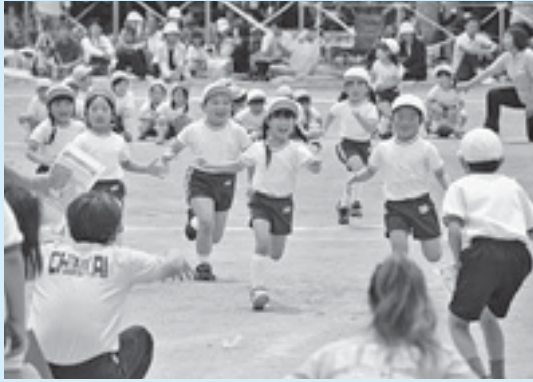
6月2日・榊梅小運動会(就学前児レース)