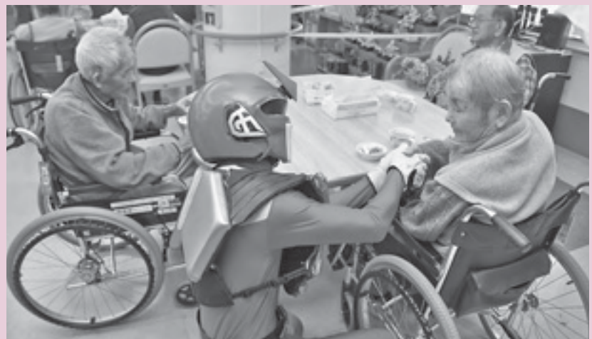
お年寄りに声をかけるソーサレッド

市民病院の患者さんと、そうさぬくもりの郷利用者の皆さんが2月下旬、本市の新銘菓「そうさまん」を試食しました。ぬくもりの郷では、なんとソーサマンが「そうさまん」を持って登場。利用者の皆さんはご当地ヒーローと触れ合いながらおいしそうに新銘菓をはおばっていました。