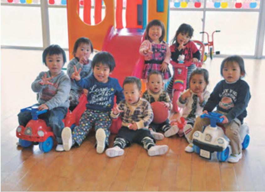
今年度から第3子以降の保育料が無料に