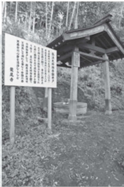
龍尾寺の弘法井戸

龍尾寺の入り口に「関東三龍之寺」の真新しい看板があります。三龍の寺とは、むかし日照りになった時に印旛沼の龍が天に昇って雨を降らせたが、その龍の体は3つに分かれて落