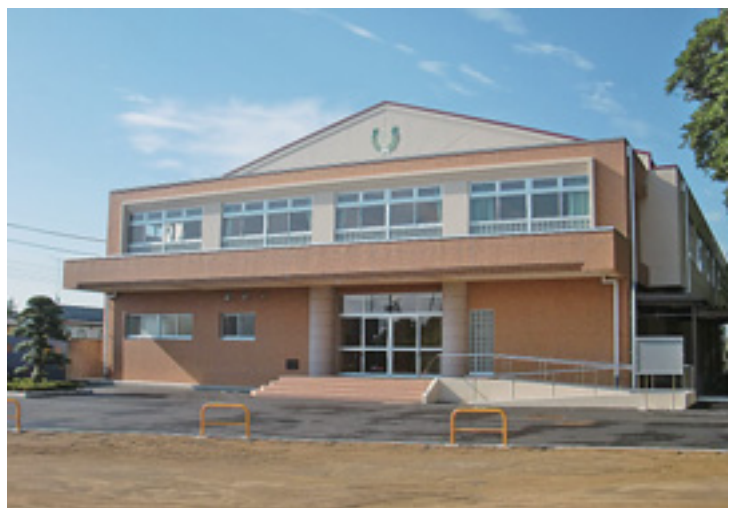
完成した八日市場小体育館

どれもが匝瑳市を盛り上げよう、匝瑳市の名を全国に轟かせようという熱い気持ちの結晶です。辰年の本年、昇り竜にあやかり、「ソーサマン」、ご当地銘菓「そうさまん」、ご当地アイドル「S☆cute」が大きく飛躍し、匝瑳市を元気づけてく