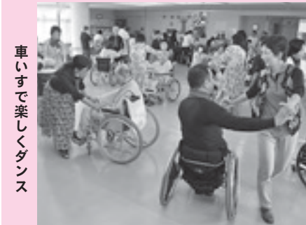
車いすで楽しくダンス