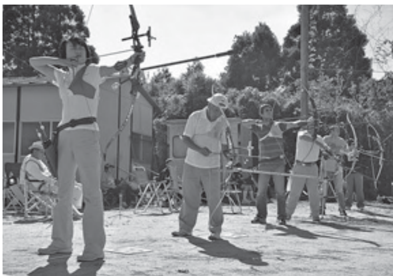
市民体育大会 アーチェリーの部(昨年)