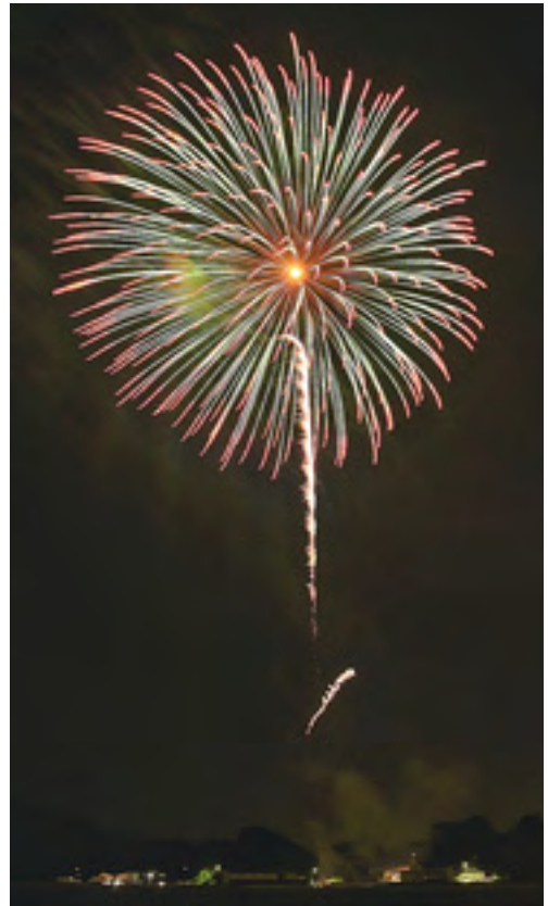
夜に咲く七色の花(昨年)

夏の夜空を彩る大輪の花火を、ぜひご覧ください。 主催…大浦はやし連 時間…20時～ 場所…匝瑳地区大浦(匝瑳保育園北側)