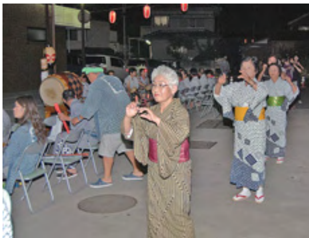
夏を締めくくる盆踊り(昨年)

時間…19時30分～ 場所…公民館南側駐車場 問 生涯学習課生涯学習室 ☎67-1266