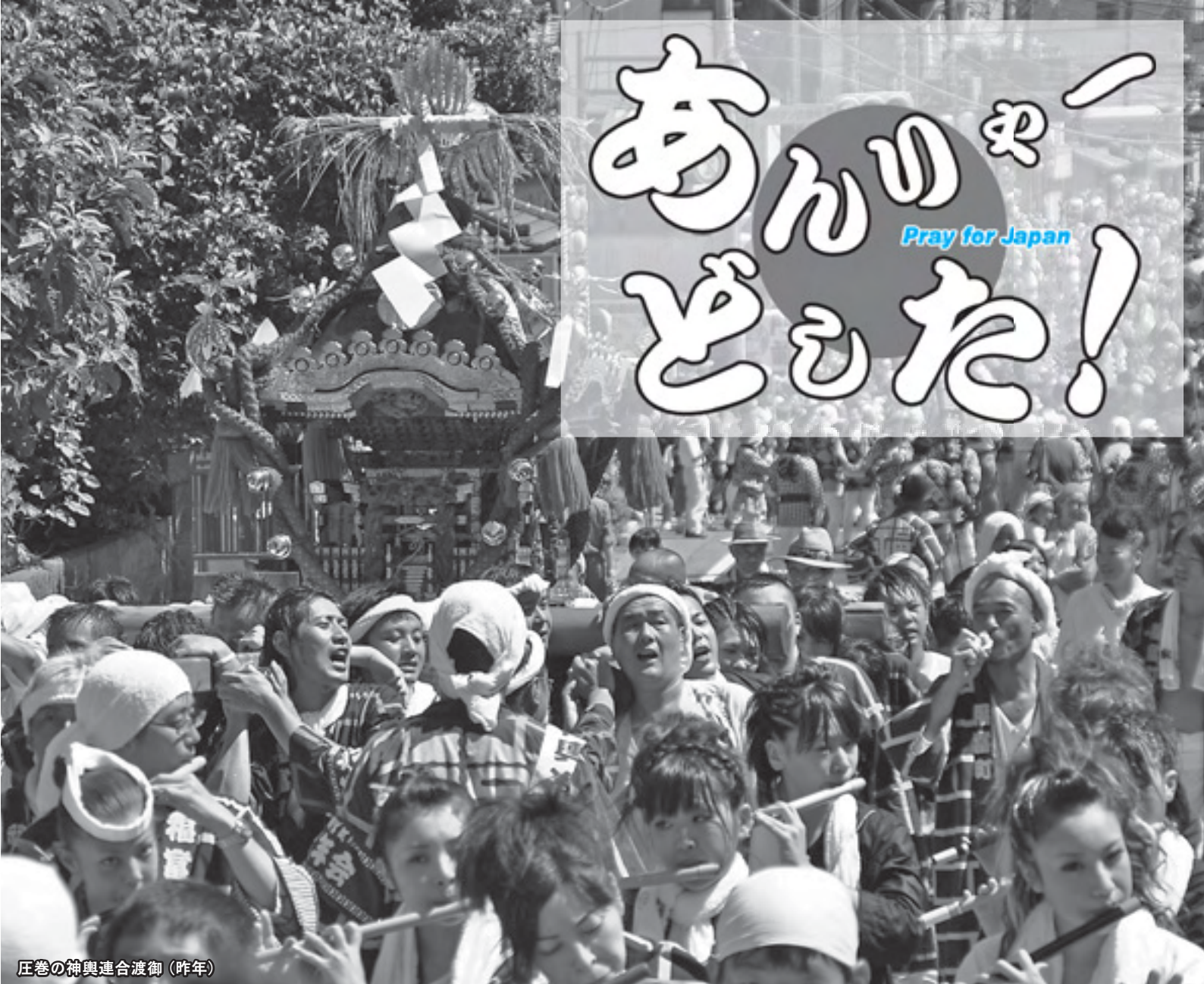
庄巻の神輿連合渡御(昨年)