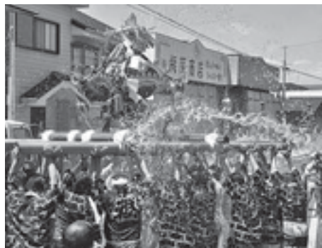
豪快に水を浴びる神輿 (昨年)

◆全路線が休止となる停留所 籠部田、法務局前、富谷、公民館入口、本町通商店街、東本町、田町、二中前 ※詳しくは環境生活課市民生活班 ☎73・0088、または運行情報案内 ☎73・0093 までお問い合わせください。