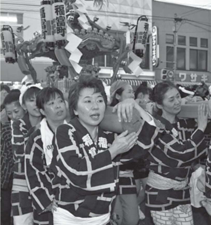
全国でも珍しい女神輿連合渡御 (昨年)