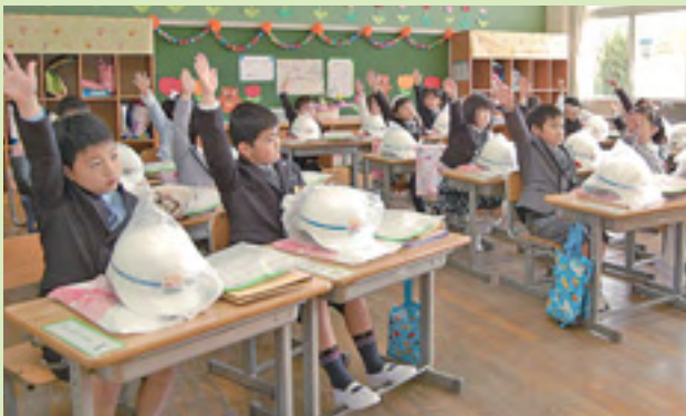
▲元気いっぱい、初めてのホームルーム（4月8日・野田小）