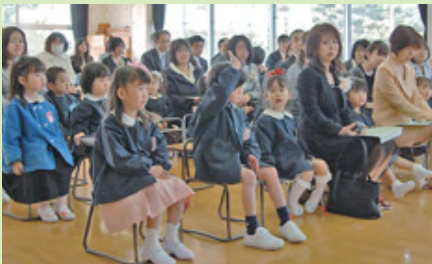
▲みんな少し緊張さみ（4月11日・のさか幼稚園）