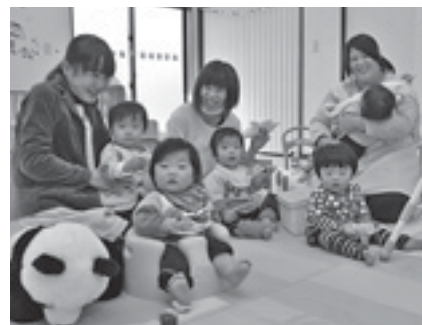
コアラハウスには元気な声がいっぱい

保育や突然の出来事に対するスポット対応も可能。院内外の研修参加や残業などでも延長保育が可能で、24時間保育も夜勤シフトのために準備しています。 当院では、子育てしながら仕事を続けたいという職員を応援しています。現在、仕事を辞めて子育て中の医師、看護師などの皆さん、短時間勤務だったらできそうと考えている人などを含め、院内保育所「コアラハウス」を活用して