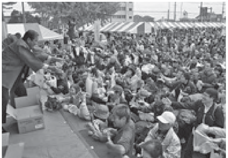
合併して5年、大きな飛躍の年に(11月・そうさ農業まつり)

年という一つの区切りを経過する匠瑳市が、新たなステージに向けて大きく飛躍できますよう、軽快なネットワークで市政運営に取り組んでまいり所存です。どうぞ、市民の皆様のご理解とご協力をお願いいたします。 結びに、本年が皆様にとりまして、幸多き年でありませう。ご祈念申し上げ、新年のごあいさつといたします。