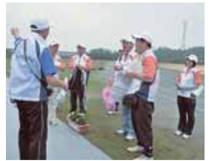
リハーサル大会でご協力いただいたボランティアの皆さん

ゆめ半島千葉国体において本市で開催される弓道競技会の運営を支え、全国から訪れる選手や監督などを温かくおもてなしするために、受付・案内、会場美化や広報活動に参加いただける