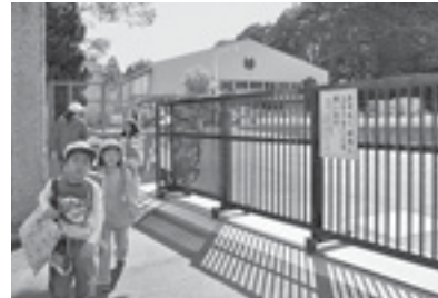
児童の安全を守る門扉を整備 (写真は八日市場小)

市では、年2回、条例に基づいて財政状況を公表しています。今回は、5月1日に告示した平成21年度予算の3月31日までの執行状況をお知らせします。なお、市の会計は、病院事業会計を除き5月31日までの出納整理期間があるため、決算額とは異なります。