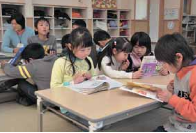
豊栄、椿海で2クラブに増設される児童クラブ (写真は昨年オープンした須賀児童クラブ)

平成22年度当初予算が3月定例会で可決されました。市の予算総額は、前年度から3・3%増の244億4,400万円。このうち一般会計は、前年度から6・2%増の133億6,300万円となりました。経常的経費を中心とした骨格予算となりましたが、子ども手当の創設など国・県の新規施策を反映した通年予算となっています。今後、政策的経費については6月補正予算で計上し、併せて本格予算とします。