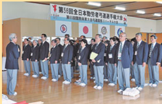
昨年のリハール大会での 競技役員の皆さん

国体の弓道競技会を担う人たちは、競技運営を担う県弓道連盟を中心とする競技役員と、大会を運営する地元実行委員会とで構成するスタッフの2つに大別されます。