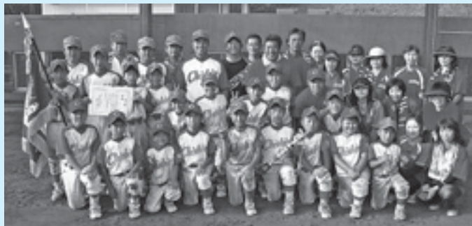
優勝した千潮スポーツ少年団