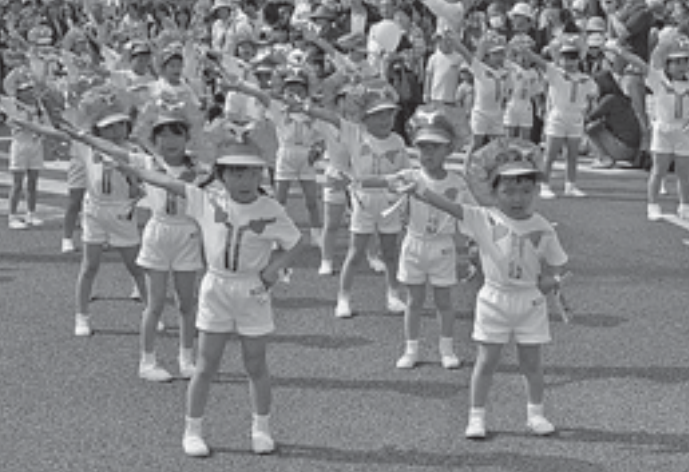
園児のストリートパフォーマンス (昨年)