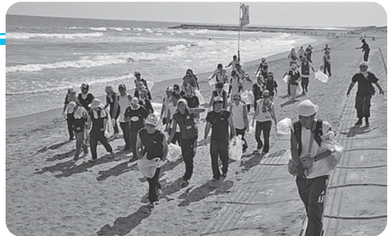
大海原を背にごみ拾い

これは、九十九里浜の全長約66kmを3日間かけて清掃するもので、本市では2日に出発式、4日に堀川浜で活動を展開。市で用意したごみ袋が足らなくなるほどのごみが集められました。