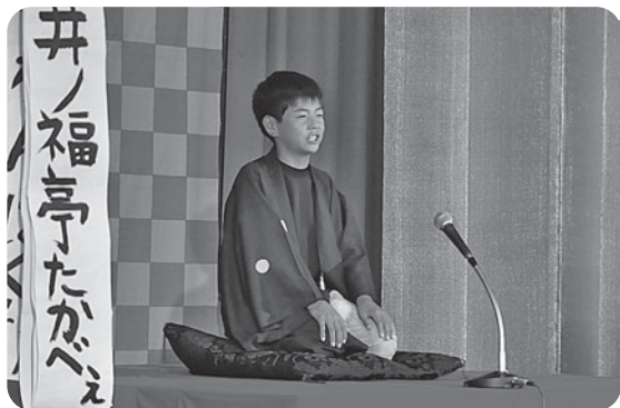
高座に上がり元気よく小話を披露

椿海小で9月9日、文化庁主催「子どものための舞台芸術体験事業」の一環として「わんぱく寄席」が行われ、全校児童および地域の保護者らが参加しました。