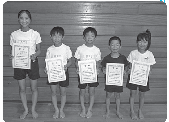
たいよう体操クラブの皆さん

銚子市体育館で8月21日に開催された「銚子市小学生体操競技大会」に、本市で活動している「たいよう体操クラブ」の小学生たちが参加。クラブ員たちは、日ごろの練習の成果を発揮し、マットや鉄棒などさまざまな競技で入賞を果たしました。