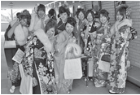
旧友との再会で記念撮影（今年）