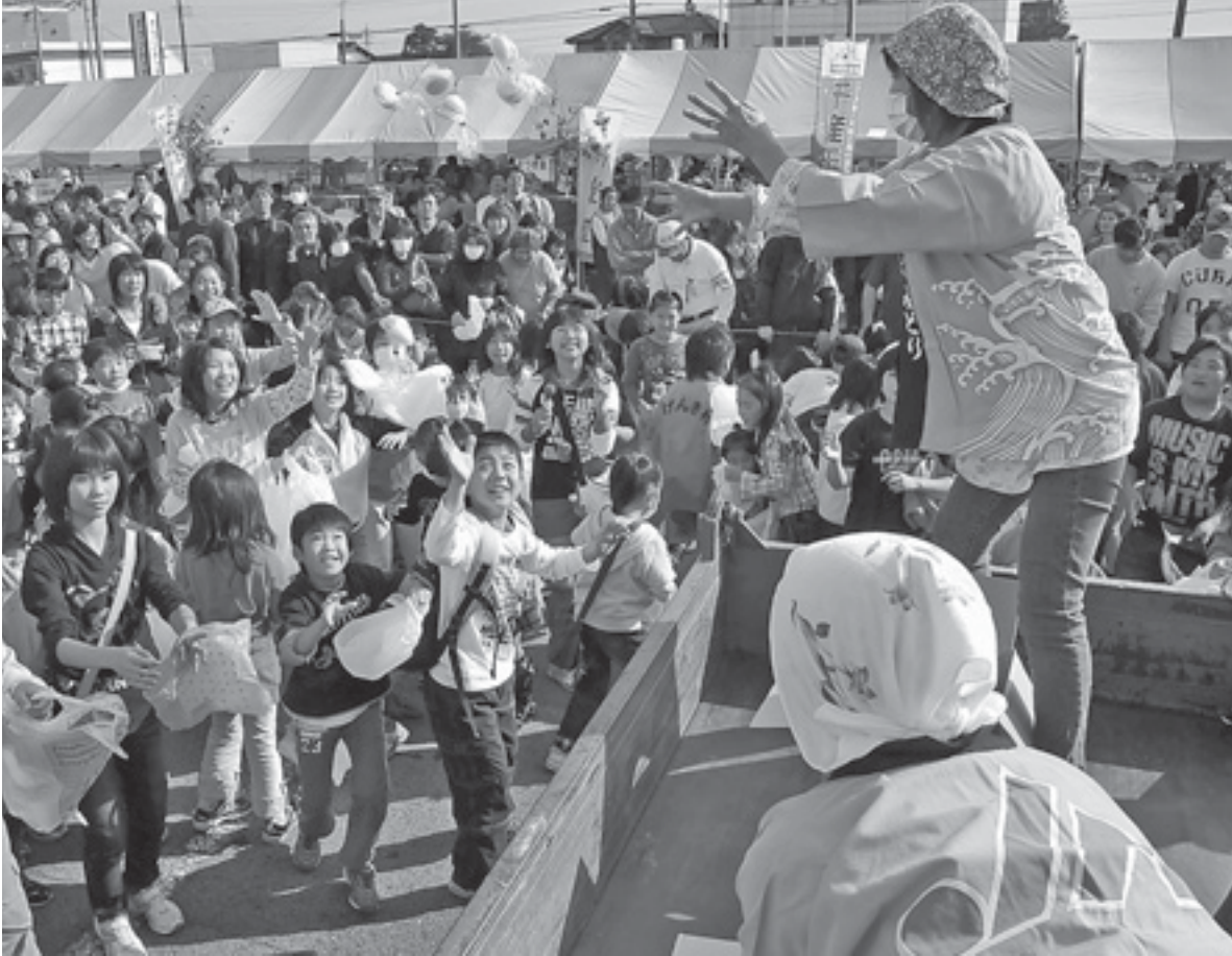
豪華景品も当たる紅白もち投げ(昨年)