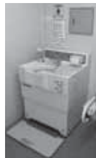
ボタンで本体が上下します

オストメイト（人工肛門・人工膀胱保持者）対応トイレを、市民ふれあいセンターに続き、野栄総合支所に整備しました。トイレ本体が上下に動く昇降式で、腹部（ストーマ）の位置に合わせることで使えます。また、トイレ内には収納式の着替え台や折りた